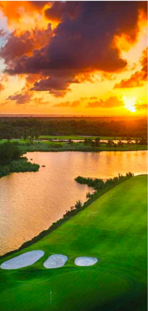
Golf SELVA & Co