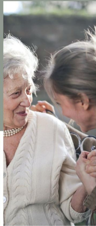
CASA DE DESCANSO Rest house for the elderly