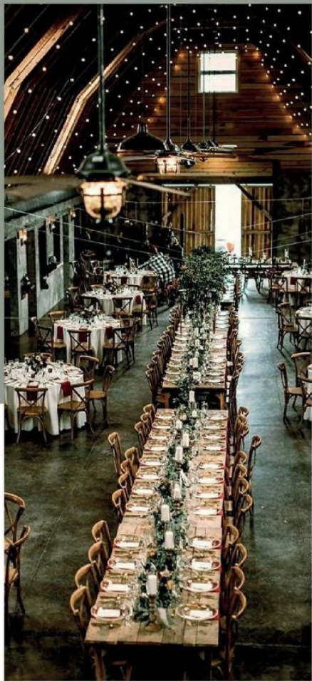
SALÓN DE EVENTOS Event Hall