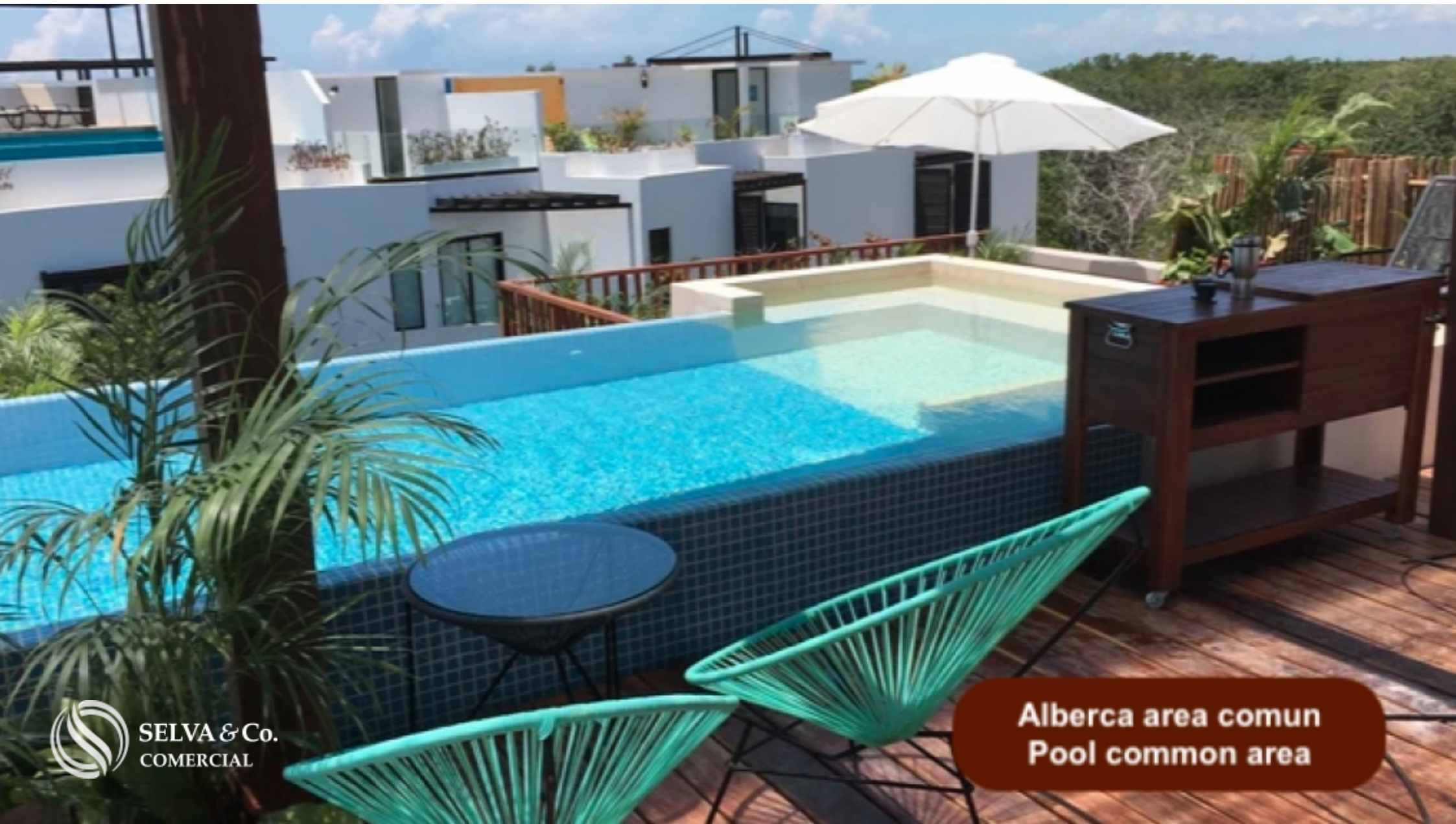
Alberca area comun Pool common area