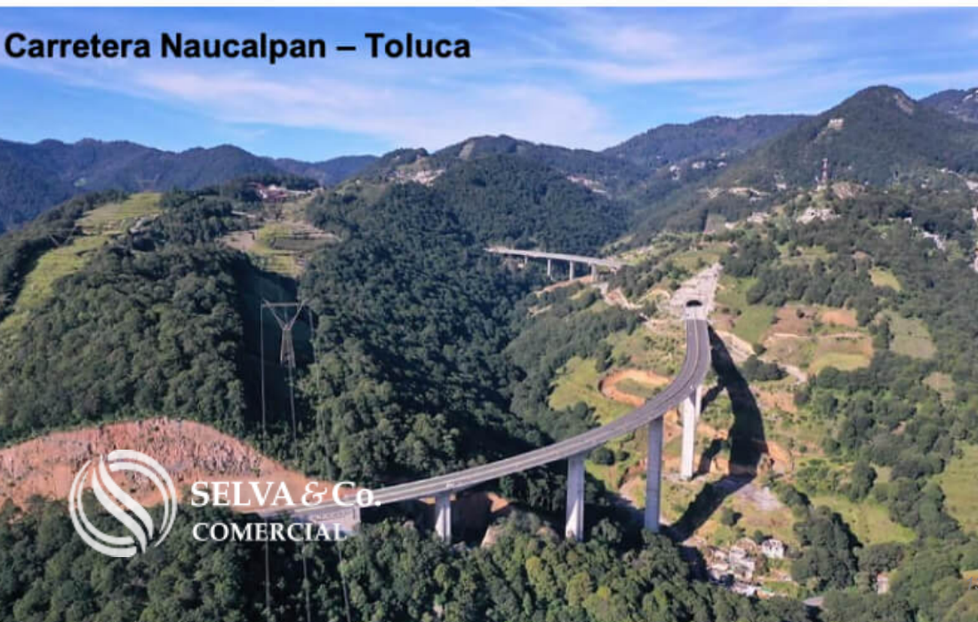
Carretera Naucalpan – Toluca