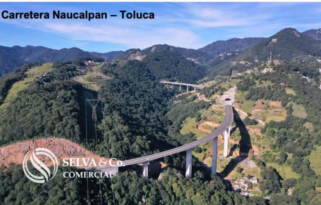
Carretera Naucalpan – Toluca