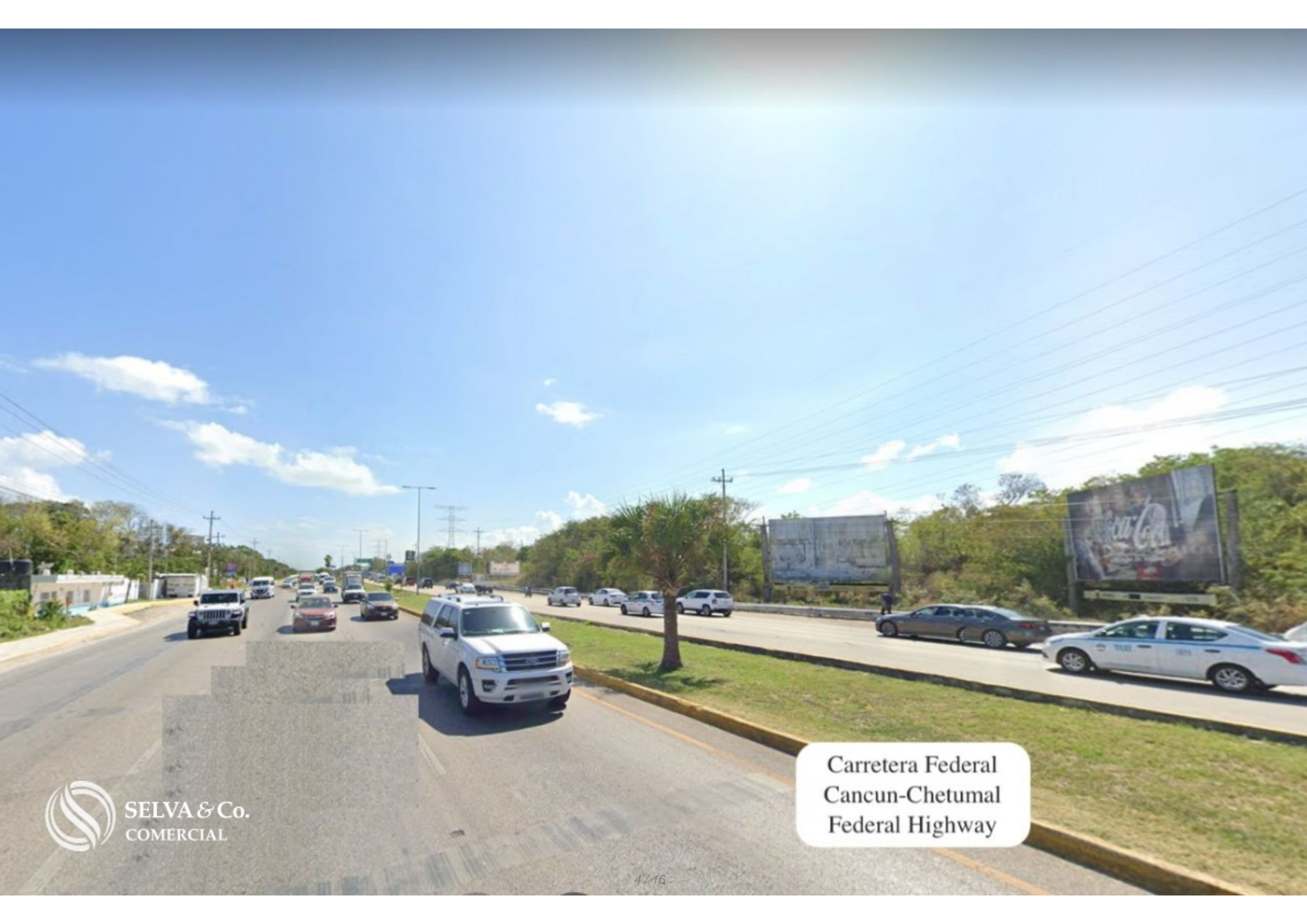
Carretera Federal Cancun-Chetumal Federal Highway