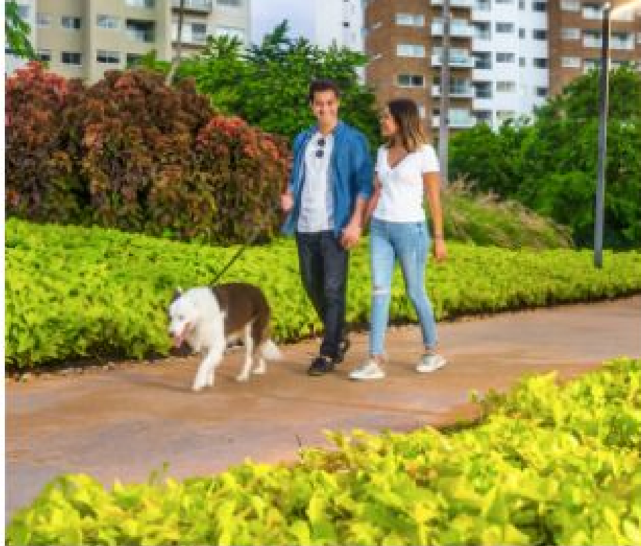
Areas verdes Green areas