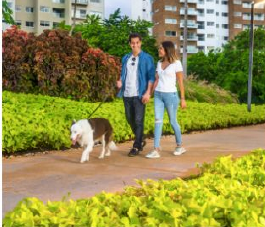
Areas verdes Green areas