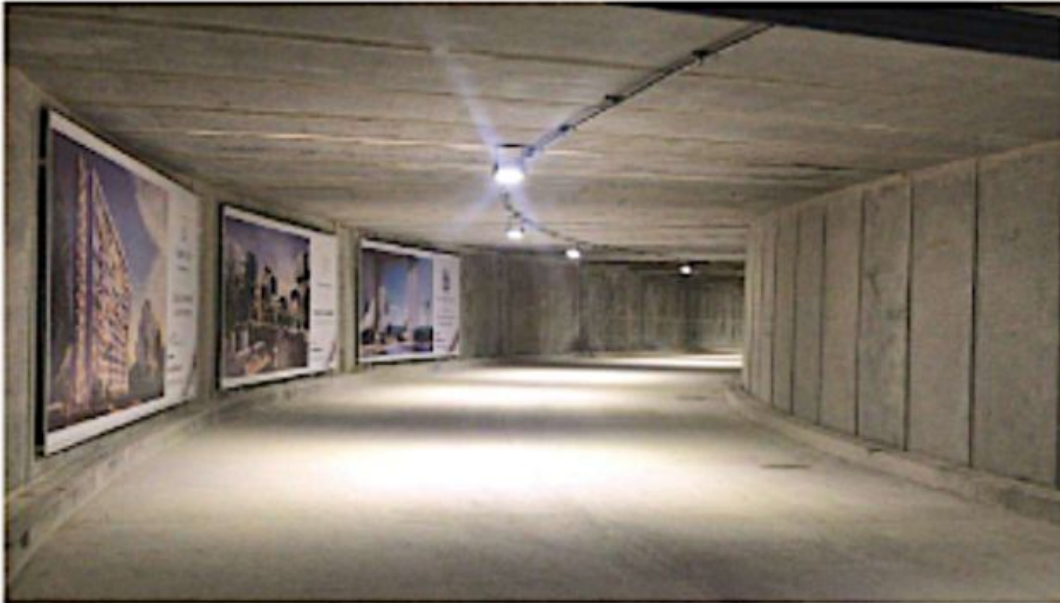
Tunel subterraneo Underground tunnel